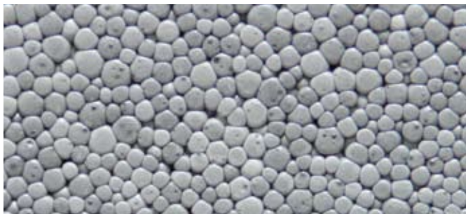
Perle di Polistirene Espanso Sinterizzato additate di grafite