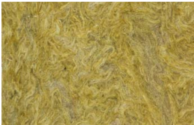
Particolare Lana di Roccia