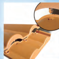
Particolare del sistema ad incastro